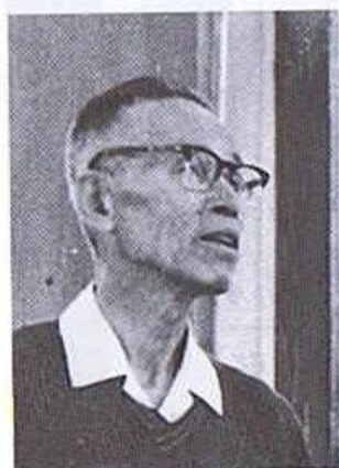
桜沢如一(左)と沖正弘氏(右)